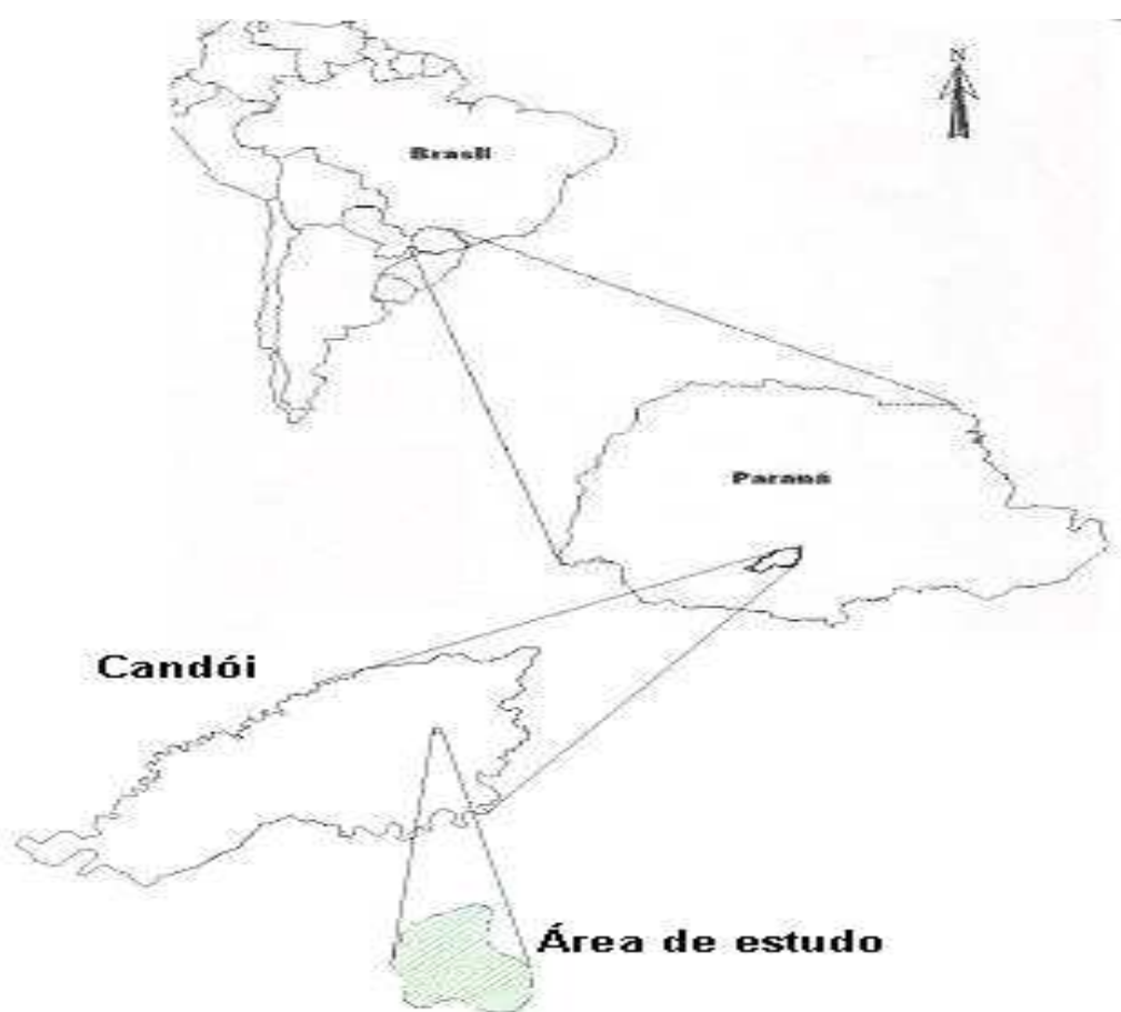
FIGURA 4 - LOCALIZAÇÃO DA ÁREA DE ESTUDO