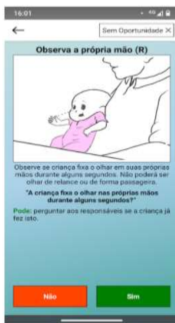
Figura 4 – Tela de teste